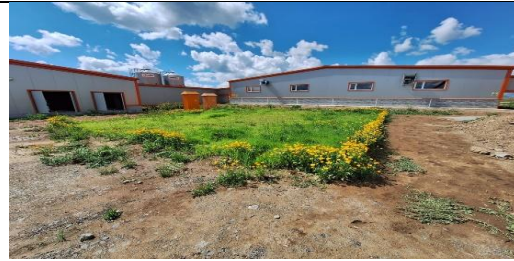
Түмэн шувуут-2 аж ахуй (СХД-ийн 21-р хороо, Их булаг)