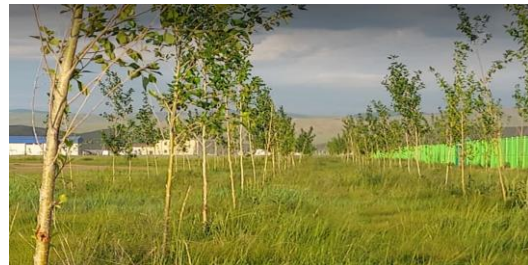
Тэжээлийн үйлдвэр (СХД-ийн 21-р хороо, Рашаант өртөө)